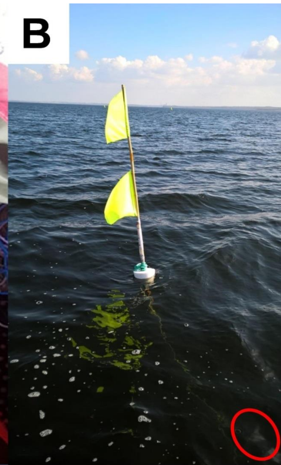
Lyttepost på flagbøje i Roskilde Fjord. Lytteposten registrerer mærkede fisk i fjorden.