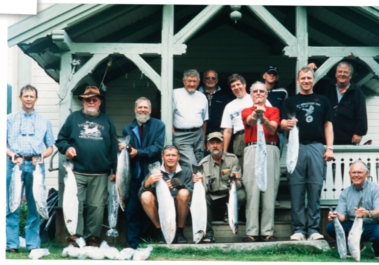
Laks til (næsten) alle mand. Gaula har igennem årene været et gavmildt bekendtskab for de mange kursister.

I løbet af et par dage kommer vi ind i dagsrytmen. Vi er seks tomandshold, og elven er delt i seks strækninger. Efter aftenmaden er vi på skift førstevælgere, og strækningerne fordeles til næste dags fiskeri. Vi fisker på de fordelte pladser formiddag og aften, mens der om eftermiddagen er frit fiskeri på hele den 1½ km lange strækning ved Bonesgården.