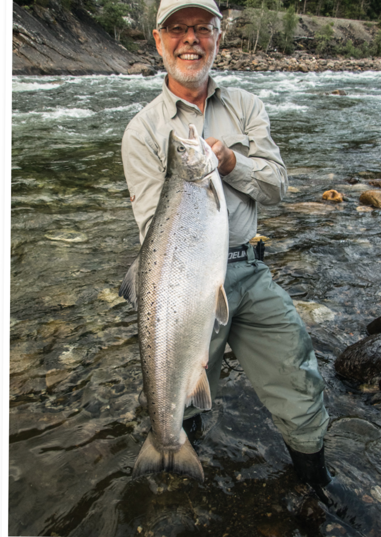
Forfatteren selv med laks på 8,2 kg.

Kl. 12-14 er der kasteinstruktion, hvor vi lærer speykastet. Nogen har deltaget på tidligere kurser og kaster flot, mens jeg selv er blandt nybegynderne. De uvante bevægelser med den lange tohåndsstang sætter sine spor. En medbragt golfalbue på højre arm bliver suppleret med et ømt venstre håndled, som må bindes ind. Men i ugens løb sker der fremskridt, og fluen kommer ud, hvor der er chance for, at en laks hugger.