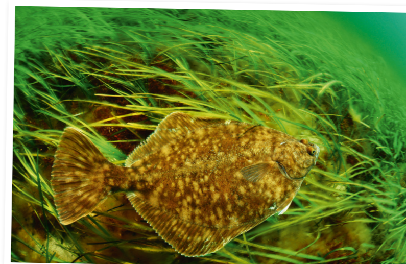
Øresunds unikke fiskebestande er dybt afhængige af en frodig og rig havbund fri for ødelæggende råstofindvinding.

nu har de Radikale så fremsat et beslutningsforslag i Folketinget, der opfordrer regeringen til i løbet af indeværende folketingsamling at undersøge mulighederne for at etablere et beskyttet naturområde i Øresund.