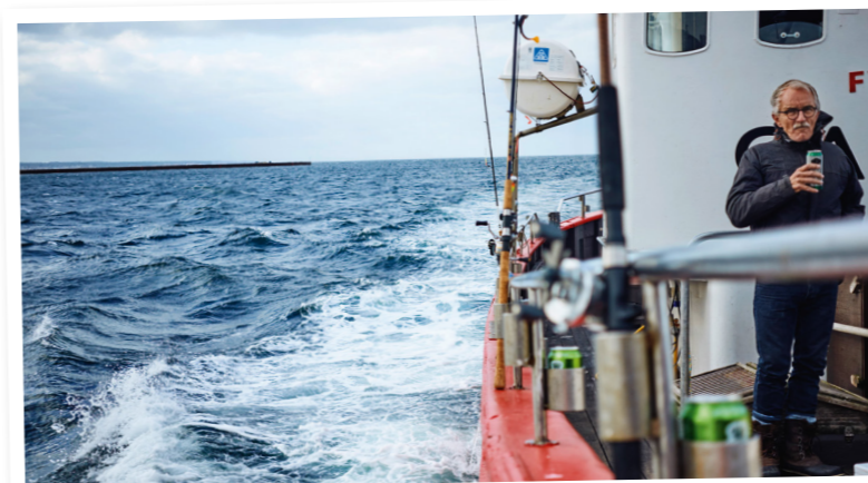
Øresundsfiskeriet generer årligt en omsætning på mellem 401 og 615 millioner kroner. Set i lyset af det er den estimerede merudgift for bygge- og anlægsbranchen på 10-15 mio. kr. meget lille.

Derfor sendte Danmarks Sportsfiskerforbund sammen med en bred gruppe af NGO'er i april 2017 en fælles erklæring til den svenske og danske regering med en opfordring til at indgå en ny fælles aftale om beskyttelse og bæredygtig benyttelse af Øresunds unikke natur- og miljøressourcer, herunder stop for råstofindvinding. Svaret fra miljø- og fødevarereminister Esben Lunde Larsen var desværre afvisende. Men