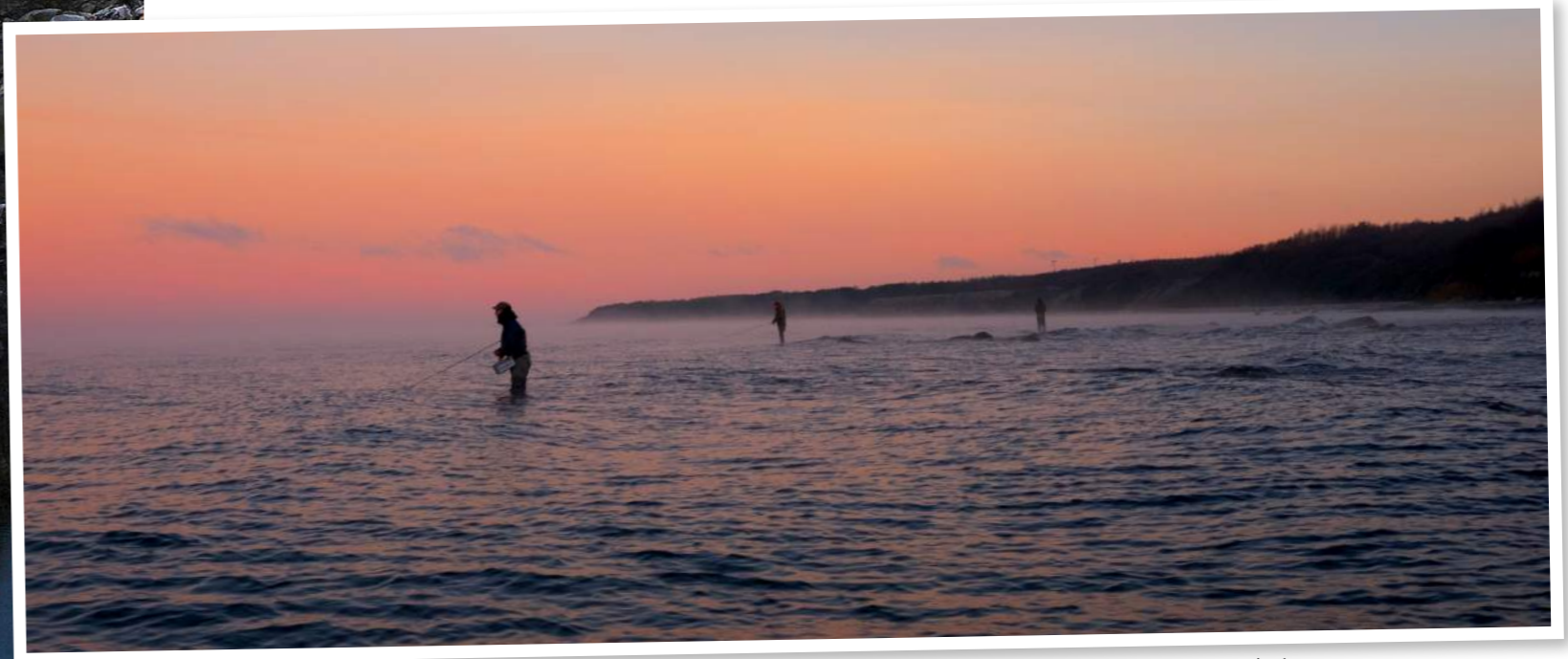
Bornholmske sportsfiskere melder om færre garn i nærheden af øens 158 km lange kyststrækning.

Reglerne i Bornholmerbekendtgørelsen er baseret på et unikt samarbejde mellem forskellige interessenter, herunder Danmarks Sportsfiskerforbund og de lokale lystfiskere på øen,