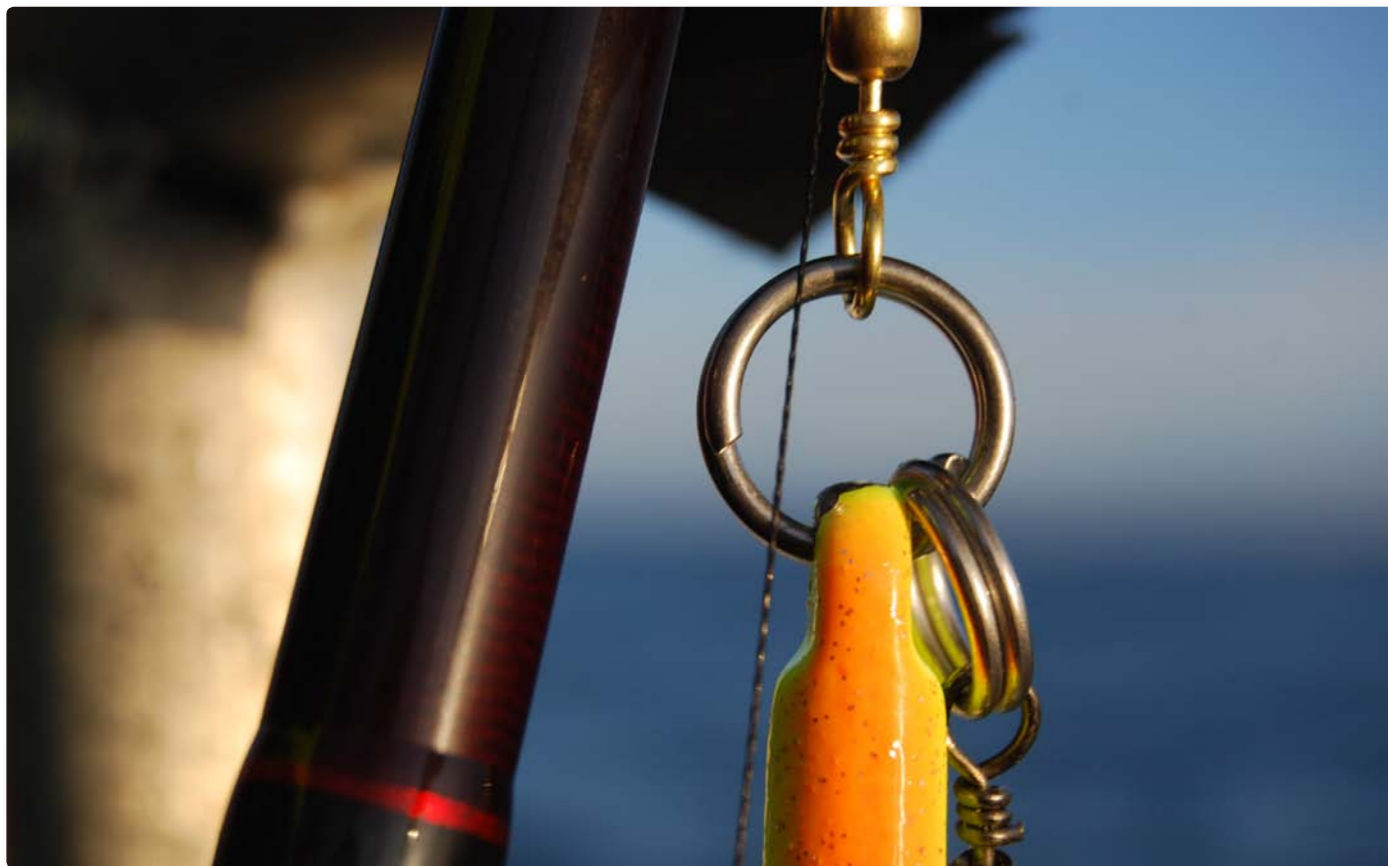
Detaljeorientering. Ved at ændre lidt på sit rig, kan man mindske antallet af fejlkrogninger betydeligt.